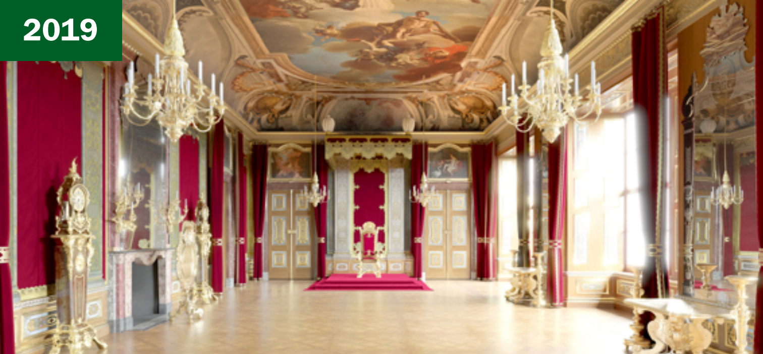
Дворец-резиденция. Зал приемов

Здесь есть что посмотреть! Приятны глазу исторические предметы из Музея декоративных искусств (Kunstgewerbemuseum) — в их числе посеребренная мебель из Аугсбурга; впечатляют живописные полотна из коллекции галереи «Старые мастера», удивляют мастерством исполнения зеркала в позолоченных рамах и пилястры Тронного зала. Во время экскурсии по дворцу можно даже «встретить» Августа Сильного лично! Точнее его фигуру в полный рост, облаченную в коронационную мантию и с регалиями в римском стиле из Оружейной палаты. Причем лицо правителя выполнено на основе его пожизненной маски.