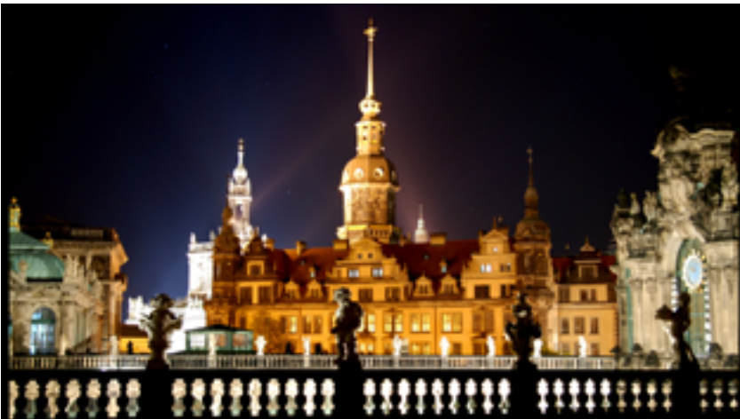
Западное крыло дворца-резиденции (Moritzbau)

За эти годы была проделана огромная важная работа, в результате которой удалось с филигранной точностью восстановить обстановку интерьера резиденции правителя Саксонии XVIII века во всем ее великолепии.