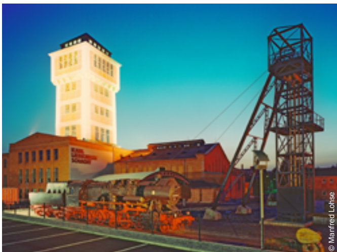
Музей горняков в Oelsnitz в Рудных горах

В Саксонии с 25 апреля по 1 ноября 2020 г. пройдут мероприятия, связанные с промышленным наследием Саксонского региона.