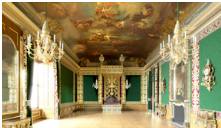
Дворец-резиденция. Тронный зал

Здесь есть что посмотреть! Приятны глазу исторические предметы из Музея декоративных искусств (Kunstgewerbemuseum) — в их числе посеребренная мебель из Аугсбурга; впечатляют живописные полотна из коллекции галереи «Старые мастера», удивляют мастерством исполнения зеркала в позолоченных рамах и пилястры Тронного зала. Во время экскурсии по дворцу можно даже «встретить» Августа Сильного лично! Точнее его фигуру в полный рост, облаченную в коронационную мантию и с регалиями в римском стиле из Оружейной палаты. Причем лицо правителя выполнено на основе его пожизненной маски.