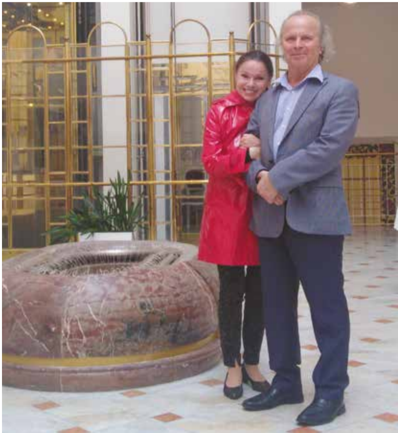
Вызвавший восторженные отклики концерт прошел 10 мая 2019 года в Общественном доме Casino и транслировался в рамках цикла «Моя Родина» и на телеканале NOE.

В рамках открытия курортного сезона состоялся уникальный совместный концерт учеников общеобразовательной музыкальной школы и скрипичных виртуозов, и гостинице Hvězda выпала честь принять настоящую звезду скрипичного мира, маэстро Вацлава Гудечка с супругой .