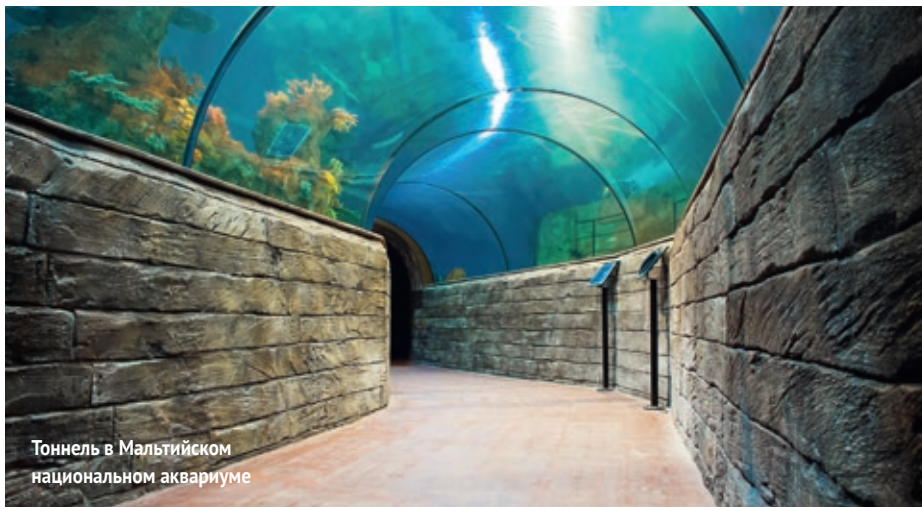
Тоннель в Мальтийском национальном аквариуме

Mediterraneo Marine Park расположен стена в стену с парком Splash & Fun. Это отличное место, где можно увидеть морских животных и пообщаться с ними. Здесь ежедневно устраиваются шоу с участием дельфинов. Гости могут поплавать с ними в бассейне и познакомиться с асами дрессировки. В представ-