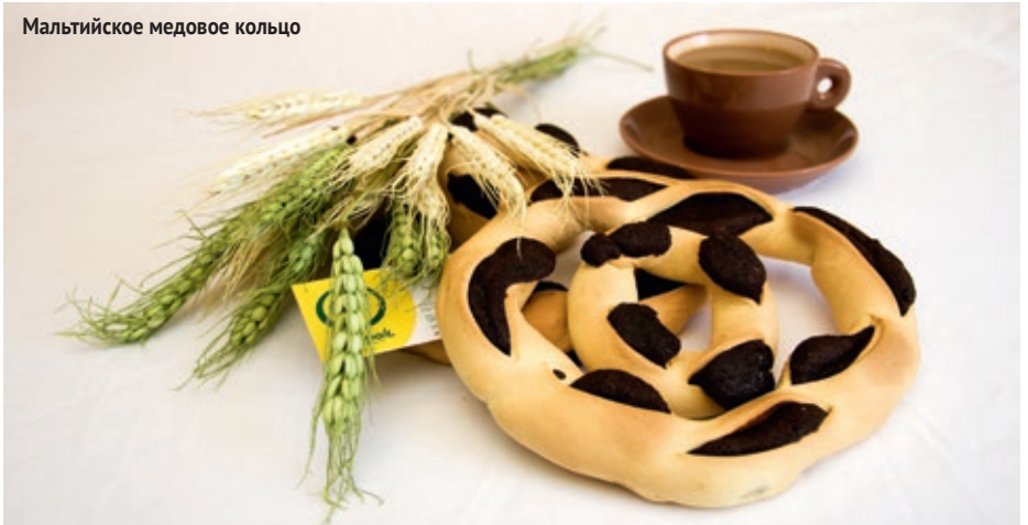
Мальтийское медовое кольцо

Напротив Мальтийской государственной библиотеки по адресу Republic St., 244-45, находится Caffe Cordina. Это самое старое кафе Валлетты. Оно было открыто в 1837 г., а на этом месте находится с 1944 г. В его сводчатых залах по-королевски роскошный интерьер. Здесь все готовится вручную по семейным рецептам: вкуснейшие горячие пирожные, печенье, удивительные медовые кольца, джемы из инжира и другие сладости.