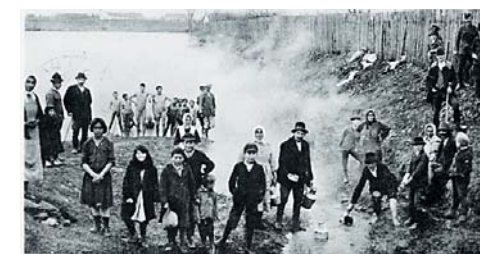
Хайдусобосло. Хайдусобосло и его окрестности в 1925.