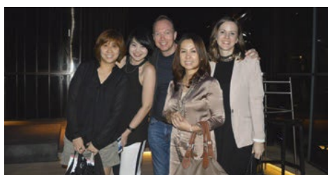
02-2016 Фам-трип для Amway Bangkok