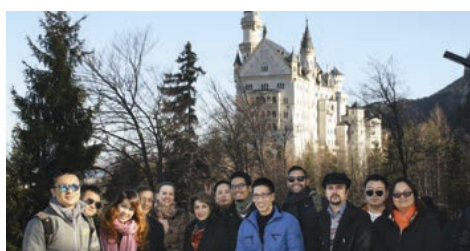
02-2016 Фам-трип в замок Нойшванштайн для Mahan Air