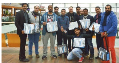
02-2016 «Люфтганза» Фам-трип Эр-Рияд