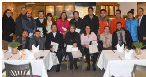
02-2016 Фам-трип для Mahan Air. Ужин