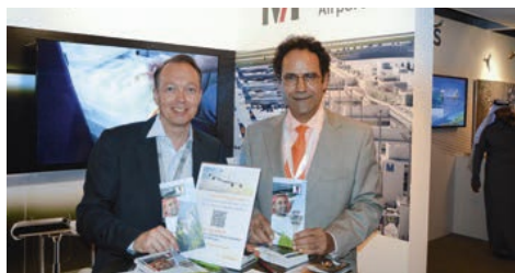
02-2016 Фестиваль Janadriyah. Эр-Рияд