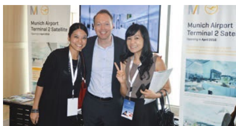
02-2016 «Люфтганза». Региональная встреча в Бангкоке