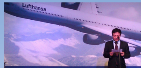
5 years Busan-Seoul-Munich