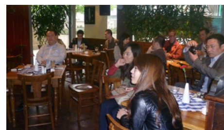
04.2012 Пресс-брифинг (Пекин)