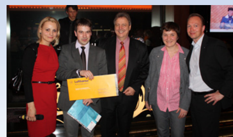
03.2012 VIP-обед с ключевыми агентами (Киев)