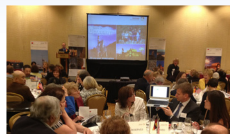
04.2012 Круглый стол GNTO (Бостон)