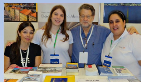
03.2012 Braztoa Бразильская ассоциация туроператоров (Сан-Паулу)