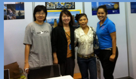
02.2012 Выставка Thai International Travel Fair (Бангкок)