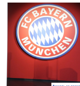
Туннель во времени

Это крупнейший в Германии музей, посвященный футболному клубу. Он находится на стадионе Allianz Arena и занимает площадь 3000 кв. м. Здесь выставлены все кубки и трофеи, завоеванные самым знаменитым немецким футбольным клубом, включая экспонаты, посвященные Францу Беккенбауэру и другим VIP-персонам клуба. Формат экспозиции стал новым словом в организации интерактивных презентаций, показа собраний материалов, картин и фотографий. Причем немецкое название экспозиции FC Bayern Erlebniswelt, документирующей 112-летнюю историю клуба, можно перевести как «Мир впечатлений FC Bayern».