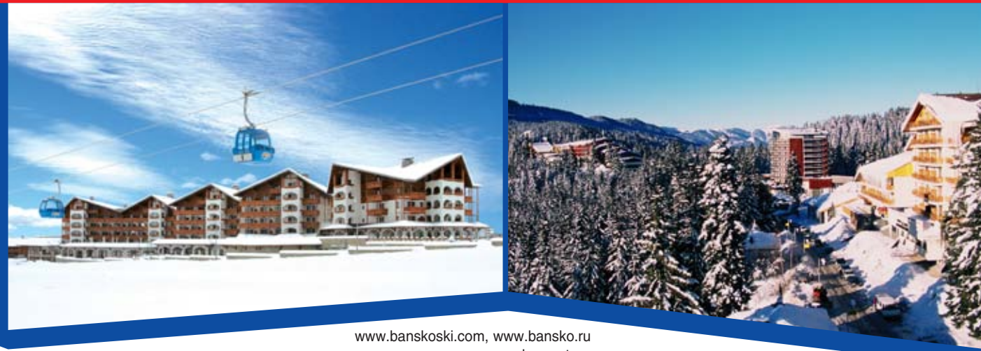
www.banskoski.com, www.bansko.ru www.pamporowo.ru, www.borovets.ru